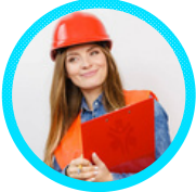
İŞ GÜVENLİĞİ UZMANI