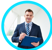
SİVİL SAVUNMA UZMANI