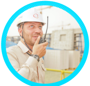
FORMEN, USTABAŞI VEYA USTA

Birden çok çalışan temsilcisi olması halinde baş temsilci