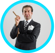
İŞVEREN / VEKİLİ